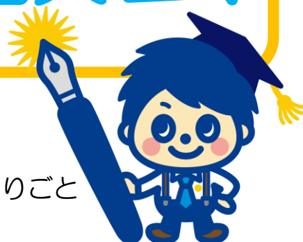
マスコットキャラクター 新久たん